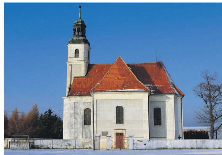
Dla zabytków - kościół w Cieślach zostanie wyremontowany

bilitacji Osób Niepełnosprawnych (PFRON). Wykonawca zapewnia serwis gwarancyjny świadczony przez Autoryzowaną Stację Obsługi z Wrocławia.