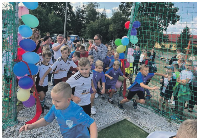
Dla młodych sportowców...