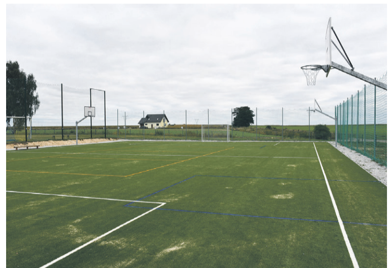
... wielofunkcyjne boisko w Nieciszwie