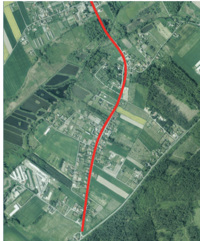
Dla pieszych i rowerzystów

24 września dokonano uroczystego otwarcia kolejnej gminnej inwestycji, tym razem w Nieciszwie. Powstało tutaj wielofunkcyjne boisko sportowe. Przedmiot zamówienia obejmował wykonanie sztucznej nawierzchni z wodoprzepuszczalnej mieszanki mineralno-żywniczej na boisku o wymiarach 26 x 42 m wraz z montażem bramek dla boiska do piłki halowej; tablic w formie ażurowych krat stalowych z kosztami z siatką łańcuchową dla dwóch boisk do koszykówki; tulei na słupki pod