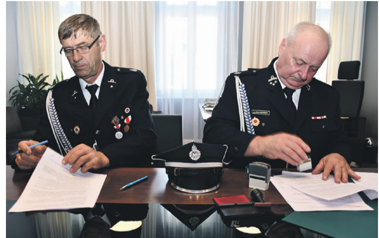
Dla strażaków ochotników

Koszt auta to 221.277 zł, z czego 105.000 zł pochodzi z dofinansowania Państwowego Funduszu Reha-