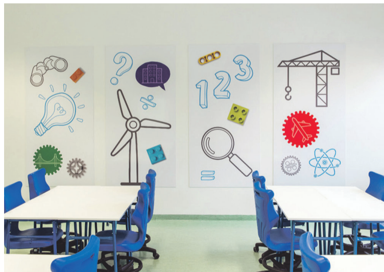
Dla uczniów - przykładowa sala lekcyjna wykonana przez Entelo