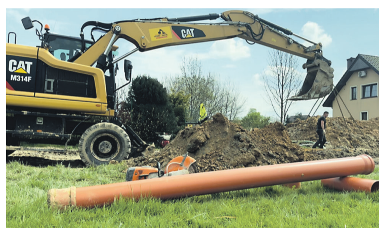
Rozbudowa kanalizacji w Smardzowie

- To zakup nowoczesnego pojazdu do odbioru i transportu odpadów komunalnych, w tym odpadów wielkogabarytowych oraz zadania inwestycyjne. Po pierwsze rozbudowa sieci kanalizacyjnej w Smardzowie i Smolnej, po drugie