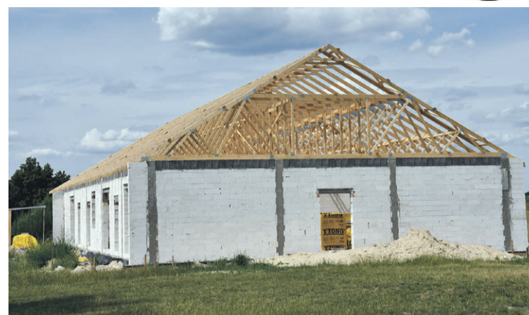
Świetlica wiejska w Boguszycach nabiera kształtów